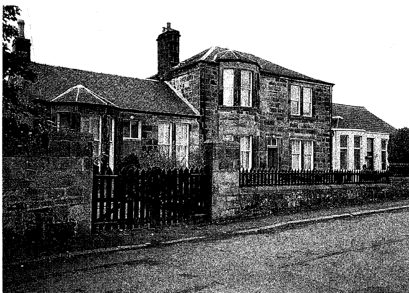
ダイアーが学んだウィルソン学校（シヨッツ鉄工所付設）