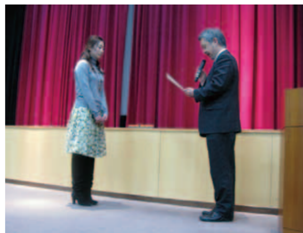
Recurrent Certificate Ceremony: Certificates were conferred to the participants at the last day of the education program.

Studies. All we have been talking about seems to converge to this point. A little while ago, we talked about the issue of RAs and PDs. While in the natural sciences, it is RAs who need support, it is PDs who need support in the humanities. What counts most in the humanities is to nurture people, that is, as individuals. These individuals must first assimilate the traditions of the humanities and become able to contemplate various issues on their own. Our focus on overseas training constitutes part of our efforts to develop such individuals.