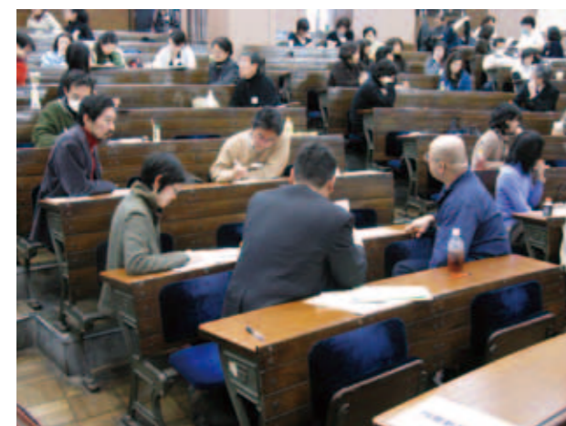
Recurrent Education Programs: Case studies by groups of health care professionals.

Shimoda: I think this is a matter of educational significance or the positioning of Death and Life