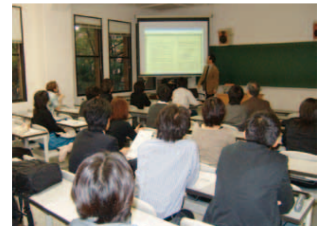
Research Meetings of Death and Life Studies: Research meetings are held periodically mainly for young researchers and graduate students.

Since the ultimate goal of the humanities is to understand human beings, we have dug deep into what makes human beings ticks through our major. However, we have come to the point where we are required to review what we have done from a broader perspective. We then reviewed it from a perspective of death and life and found many important issues related to different disciplines, such as medicine and law, which have led to the restructuring of past academic work from a broader view. We consider this process as education necessary to consolidate specialized fields. In the past, there has been no place providing this type of education.