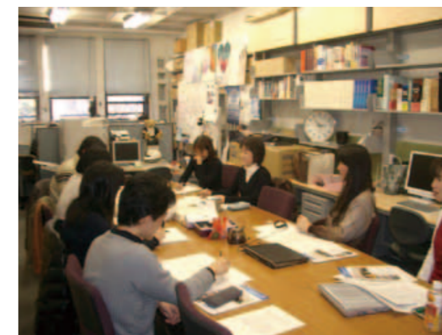
G-COE 研究室……グローバルCOE 研究室内の若手研究員たち

島菌： イスラム圏に行ったら英語で話すことが多くなるし、インドでも恐らく同じです。ただ、中国、韓国の場合は漢字圏ということがあるので、その共通性が土台にあって、英語で行なうと、なぜ私たちは英語で話さなくてはいけないのかという不全感が残ります。ですから難しいですね。もちろん英語でもやりますが。