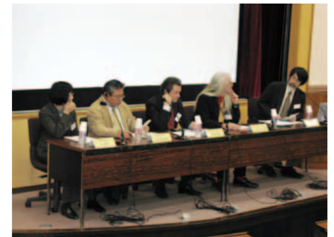
国際シンポジウム「死生と造形文化Ⅰ——「聖遺物とイメージの相関性——東西比較の試み」

こうした状況を踏まえ、東大の大学院人文社会系研究科（文学部）では2002年より医学部・教育学部などの他部局と協力しながら、21世紀COE「死生学の構築」プロジェクトを進めてきた。2007年から2012年春までのグローバルCOE「死生学の展開と組織化」では、これを踏まえ、新たな学問領域の確立と若手研究者の育成を目指して、さらに強力な教育・研究体制を構築していく。東京大学の「死生学」プロジェクトの第2期として重い課題を担う。