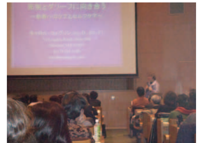
死別とグリーフに向き合う——他者へのケアとセルフケア