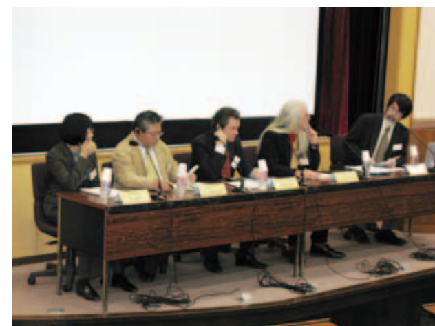
Relics: Perspectives of death and life of the East and the West were discussed at the international symposium.

Shimoda: A process to tap into the accumulated materials in local languages is indispensable and it takes a long time to do so when only using English.