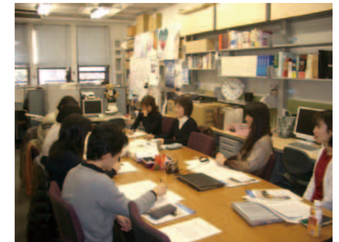
Global COE Laboratory: Young researchers in the Global COE laboratory of Death and Life Studies.

Shimazono: We rely heavily on experts of each language, such as Japanese researchers in Chinese studies or Chinese researchers in Japanese studies mentioned before. When we hold a conference in the Islamic world, we talk with people whose native language is Arabic via Japanese who speak Arabic fluently. Through these contacts, we strive to develop Arabians who may become specialists in Japanese culture. We need to take such a long-term perspective.