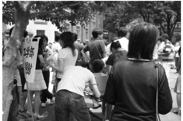
避難・安否確認訓練中の参加者

訓練では、突発地震発生時の対応行動訓練を目的とし、地震発生時の対応マニュアルに沿った、初期対応→緊急対応→避難→安否確認、という地震発生時の行動が、号館対策部(各建物の対策本部)と工学系等対策本部の間で連絡を取りながら進められた。