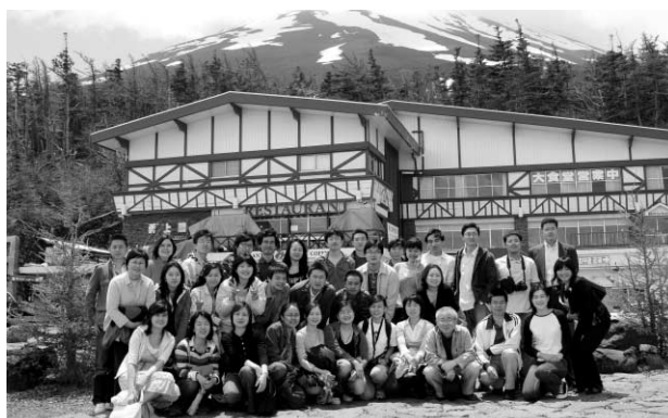
富士山五合目で集合写真

富士山は、旅行後のアンケートで毎回行き先として人気が高かったため、今年の訪問先に決めた。