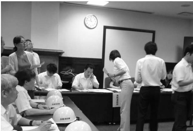
対策本部（列品館）で号館対策部からの連絡を受ける

的スムーズに安否確認を行うことができた。しかし、条件によっては一斉放送が聞こえにくかったなどの問題点の指摘もあったので、来年度以降の課題としたい。