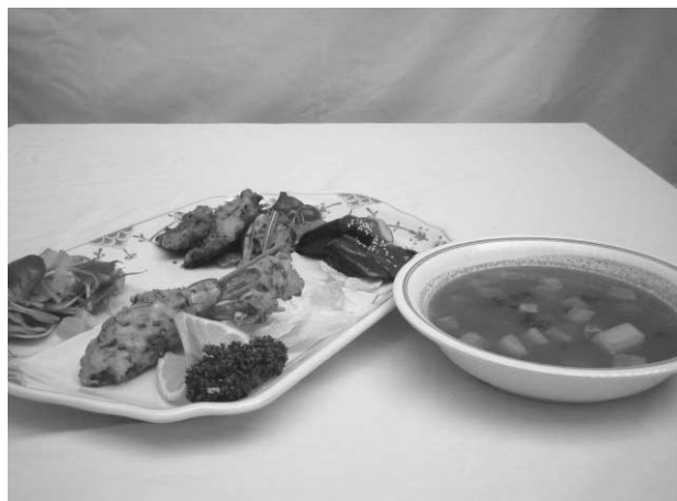
料理の一例（奥から反時計周りに、鶏肉のポテト衣焼き、野菜とパブリカのサラダ、えびの豆腐衣揚げ、ナス田楽、トマトスープ）

各施設自慢の料理を盛り付けたワンプレートディッシュは、目にも楽しく、食べても大満足の出来栄で、試食は大いに盛り上がりました。