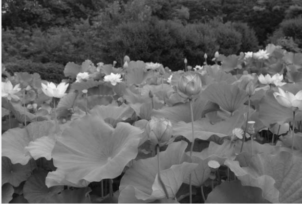
緑地植物実験所で咲く花ハス

なお、この企画にあわせて関連の展示をコミュニケーションセンターで行っておりますので、是非ご覧下さい。