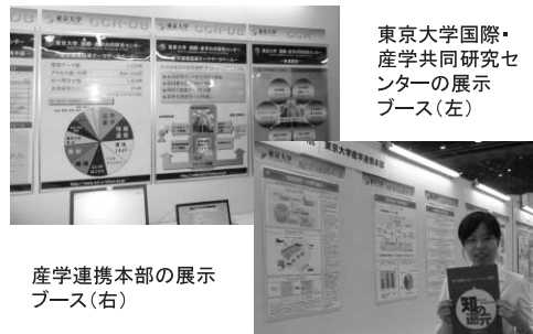
産学連携本部の展示ブース(右)

午後からの分科会では、①イノベーション、②地域から世界を目指す地域クラスターの強化、③第2期を迎える大学の知的財産戦略、④求められる高度理工系人材をテーマにそれぞれ話し合われました。