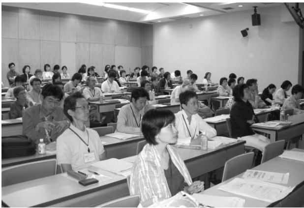
熱心に聞き入る参加者

その後、山上会館にところを移して懇談会が開かれ、和やかな雰囲気の中に、会は終了した。