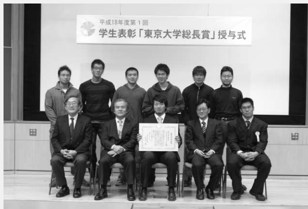
昨年度の記念撮影風景

http://www.u-tokyo.ac.jp/stu01/h12_j.html