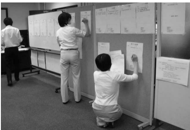
各号館から受けた連絡事項を本部のボードに記入する

また、関連行事として本郷消防署による体験型防災訓練が同日12時20分～14時に工学部1号館前広場で実施され、多くの地震訓練参加者が引き続き参加した。地震の少ない地域からの留学生も激しい地震のゆれを体験するなど、好評であった。