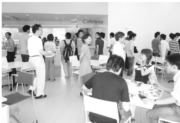
オープン前の試食会