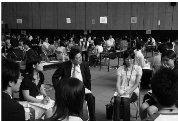
副学長も輪に入れられ・・・

第二部は、ところを中央食堂に移して午後5時半から、今度は卒業生に所属する業界別に分かれてもらい、特にテーマを絞ることなく学生とのフリーディスカッション方式。懇親会を兼ねながら約1時間半、なごやかに会話の輪が広がった。