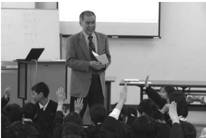
小学校での出前授業。イヌを題材に進化を教える筆者