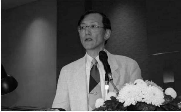
司会進行をする加藤照之地震研究所教授