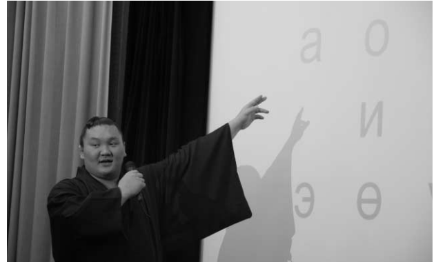
発音練習を共に行う白鵬関

心にモンゴル語を学んでいる。また、今年は、日本・モンゴル国交樹立35周年の年にあたり、「モンゴルにおける日本年」でもあるため、この6月には、モンゴル国のナンバリン・エンフバヤル大統領から本学創立130周年記念に祝辞のビデオレターが寄せられ、そこでもモンゴル語履修者にも励ましの言葉が送られている。