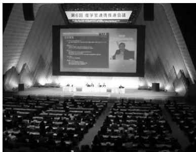
メイン会場の大会議場は常に満席だった

6月16日(土)～17日(日) 国立京都国際会館にて、第6回産学官連携推進会議が開催されました。この会議は、産学官連携を担う第一線のリーダーや実務経験者等が一堂に会し、具体的な課題について、研究協議、情報交換、対話・交流・展示等の機会を設けることにより、イノベーションの創出に向けた産学官連携の新たな展開を図るために開かれたものです。参加者は年々増加し、今年は登録者数だけで4千人を超えました。