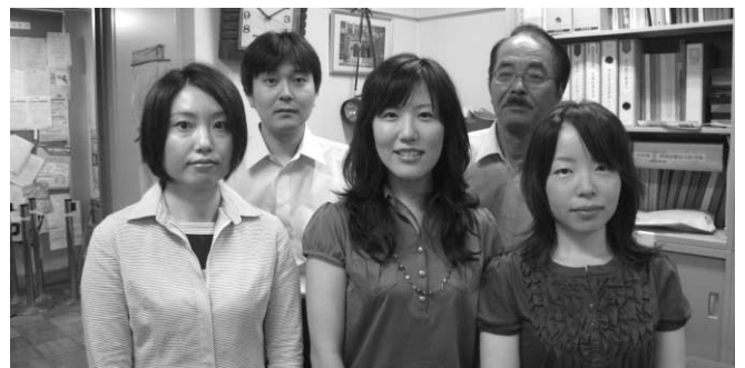
アットホームな職場です

一年が入学式の準備に始まり、卒業式の後片付けに終わるので、自らの学生時代を懐かしく感じると同時に、常に先生や学生を意識した細やかな気配り、急な質問や要望への速答力を身に付けられるよう多くの事を吸収していきたいと感じる毎日です。