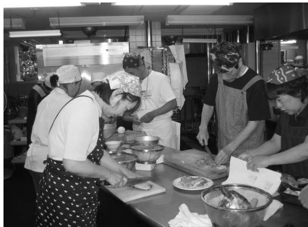
自慢の料理に活き活きと腕を振るう

および「ワンプレートディッシュ」（1つの皿に主菜、副菜、ご飯・パンなどが盛り付けられた、コンパクトながらボリュームのある食事）の調理実習が行われました。