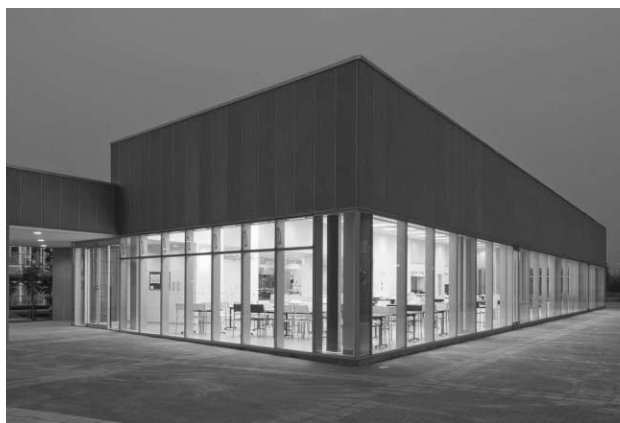
竣工となった『プラザ 憩い』

柏キャンパスの増大する教職員、学生のニーズに答えるため、7月2日に2番目の食堂『プラザ 憩い』が、柏図書館北側にオープンしました。柏キャンパスには、研究所、センター、大学院が相次いで移転しており、これにより学生数が大幅に増え、人口分布も東西に広がってきました。既存の食堂(カフェテリア)では席が不足し、移動も不便という状態になりました。昨年度、キャンパス西側に環境学研究棟が完成すると同時に、1階に仮設弁当売場が作られ、併設して新食堂の建設が始まりました。