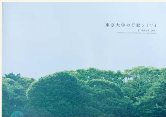
『東京大学の行動シナリオ FOREST2015』パンフレット

【つねに日本の学術の最前線に立つ大学(Front)】、 【多様な人々や世界に対して広く開かれた存在(Openness)】、 【日本と世界の未来を担う責任感(Responsibility)】、 【教育研究活動における卓越性(Excellence)】、 【それらを持続させていく力と体制(Sustainability)】、 【知に裏打ちされた強靭さを備えた構成員(Toughness)】。 『行動シナリオ』はこうした精神をバックボーンとしています。