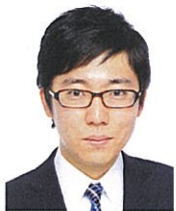
理学系研究科 修士課程二年

吉田氏は、「悲しいから泣く」のではなく「泣くから悲しい」という認知心理学の知見を工学に応用し、疑似的な身体反応のフィードバックによって任意の感情を人工的に喚起する手法の構築に取り組んだ。画像処理を用いて疑似的に生成した表情を自身の実際の表情であるかのように見せることで、感情体験に影響を与える鏡型のシステムを構築した。このシステムによって、快・不快感情を喚起することができ、また、選好判断をも操作できることを明らかにした。これらの成果は国内外の学会で発表されただけでなく、グッドデザイン賞を含む複数の賞を受けるなど、学術領域内外で高く評価されている。こうした活躍や研究内容の独創性が高く評価された。