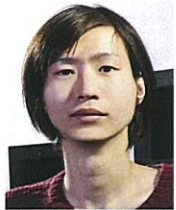
学際情報学府 修士課程二年