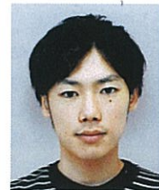
数理学研究科 博士課程修士

従来の幕末・明治期の歌舞伎に関する研究は、江戸・東京の大芝居(大劇場)における上演演目や、その作者・役者等に関する考察に集中しており、上方劇壇や小芝居に対する目配りは相対的に不足していた。日置氏は、台本に加えて番付や錦絵、新聞といった周辺資料を用いて、江戸・東京と上方、大芝居と小芝居の双方に目を向けた作品研究を行い、この時期の江戸・東京劇壇と上方劇壇の相互的な影響関係の諸相を明らかにした。これによって、当時の代表的狂言作者である河竹黙阿弥とその門弟の作風をより詳細に把握し、また従来の歌舞伎史では軽視されがちであった幕末から明治前期の上方歌舞伎の演劇史的意義を再評価するなど、より立体的な幕末・明治期の歌舞伎史を構築した。