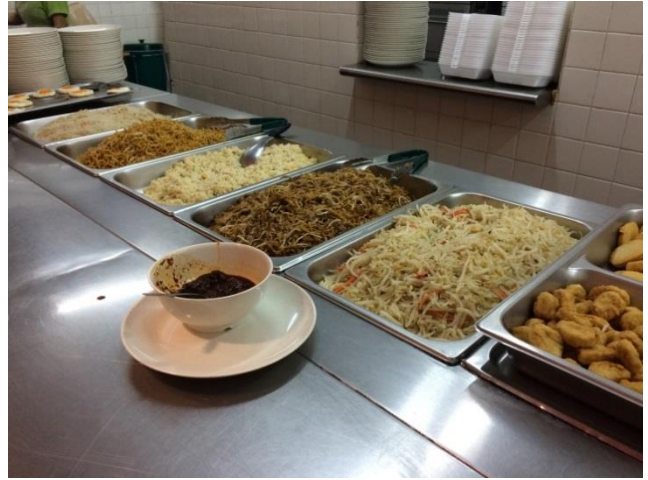
(Dinner / Breakfast: Food in Raffles Hall)