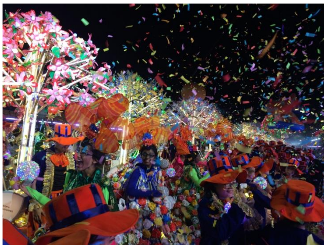
(Chingay 2015: the Performance and Float Parade)