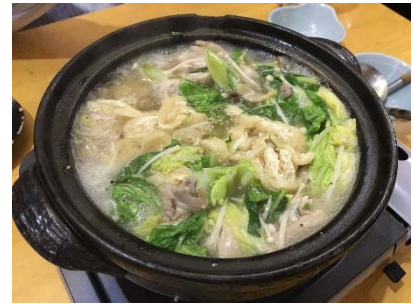
Byobu and Chanko-nabe