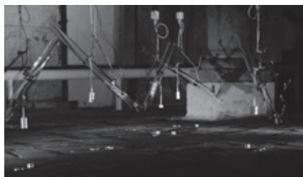
図2:レイケ管による熱音響変換現象を利用した サウンドインスタレーションSoundform