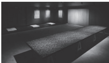
図1:西陣織に機能性材料を組み込んだ 環境呼応型テキスタイルAmbient Weaving

以上のような観点から、本講演では物理素材や空間の特性を活かす研究や作品を紹介し、実世界に調和する技術や実素材・現象から立ち現れる表現の可能性について議論します。