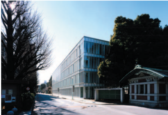
法学政治学系総合研究棟の外観