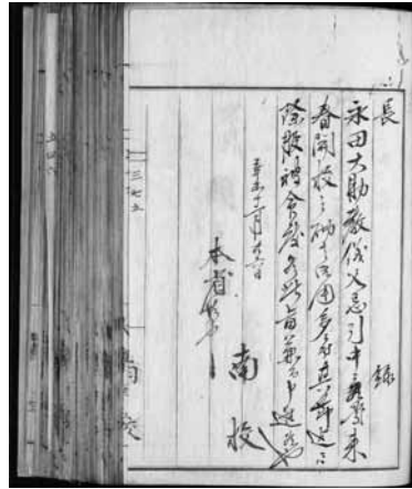
図3 明治4年甲 375

これに対して、大学から出したものに関して原文書は文部省側に保管されるため『文部省往復』に収録はされていない。したがって収録されているのは写しであり、大学側の用紙が使用されている(図3)。ただし、「往復」と題されているように何などで文部省に出され、許可申請が降りた文書に関しては文書の後半に朱書きで「何之通」のように朱書きされている場合がある(図4)。