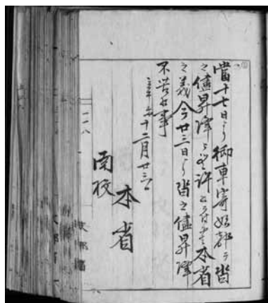
図2 明治4年甲118（番号は通し番号）

本文に使用されている紙は達などの場合は原文書であるため発行した組織の用紙が使用されている。文部省から発行された文書の場合は文部省の用紙になる。欄外には朱書きで大学側の受け取りの日時が記されている場合があり、また、受領の際の事務処理のため大学側の組織の押印（個人印）がなされている場合がある。この押印は「長」、「録」とされる場合もあり、その際は「長」、「録」の文字の横に責任者の押印がなされている。また、左側に目次で記された通し番号が同じく朱書きで書かれている（図2）。