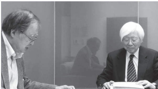
インタビュー風景 左：佐藤特命教授 右：吉川弘之総長

文書館では、2017年度より元総長のインタビューシリーズとして、録画・録音による記録化を開始した。これは東京大学150周年事業で構想されている年史編纂協力を視野に、文書館が進める本学基軸資料の体系的収集の一環として実施しているものである。本学総長に関する所蔵資料は、一部個人資料として活用されているものもあるが、総体としてその役割を検証するには不十分な状況にある。そこで元総長に対するインタビューを実施して、オーラル・ヒストリーによる記録化に取り組んできた。