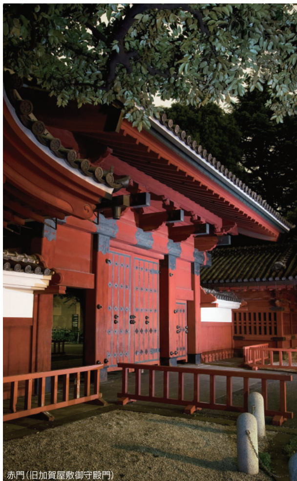
赤門(旧加賀屋敷御守殿門)