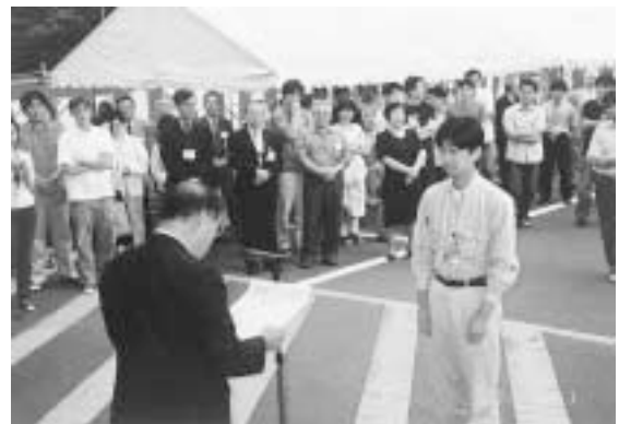
▲研究成果発表会Best Posters表彰