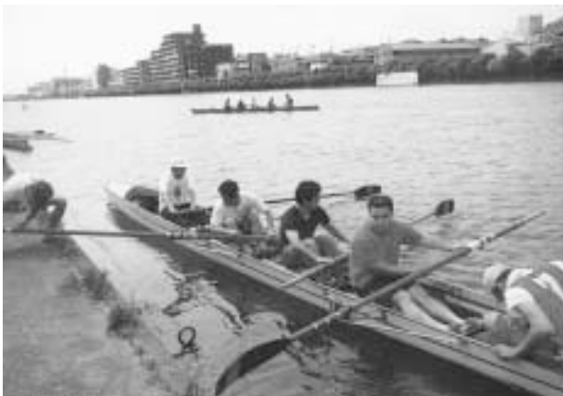
▲スタート地点へ向かう選手達