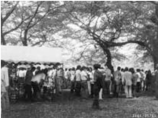
(大学院理学系研究科・理学部)

学生・教職員はもとより名誉教授にもご参加いただき、芝生には飲み物などを手に語り合う懇親の輪がいくえにも広がり、植物園の誇る自然を満喫しつつ和気藹々とした楽しい一時を過ごした。