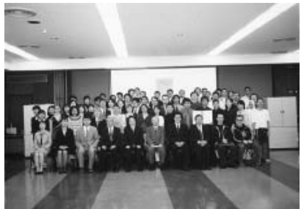
副学長と一緒に修了記念撮影