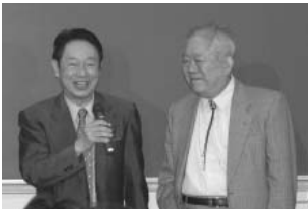
記者会見場に駆けつけた江崎玲於奈芝浦工業大学学長（左）と小柴昌俊名誉教授（右）