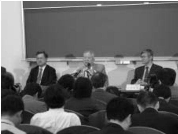
記者会見に臨む小柴昌俊名誉教授（中央）