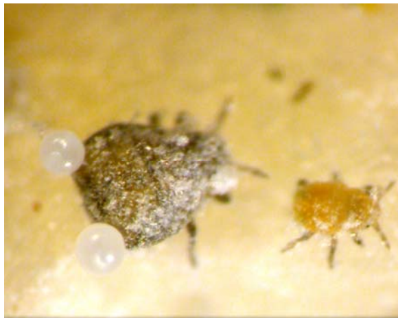
図2. ヨシノミヤアブラムシの2種類の兵隊。無翅成虫(左)は分泌液で付着することにより敵の動きを止め、1齢幼虫(右)は口吻で刺すことにより攻撃を行う。