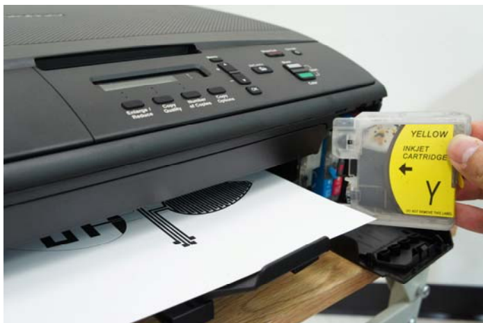
図1 銀ナノインクを装填したインクジェットプリンタ。