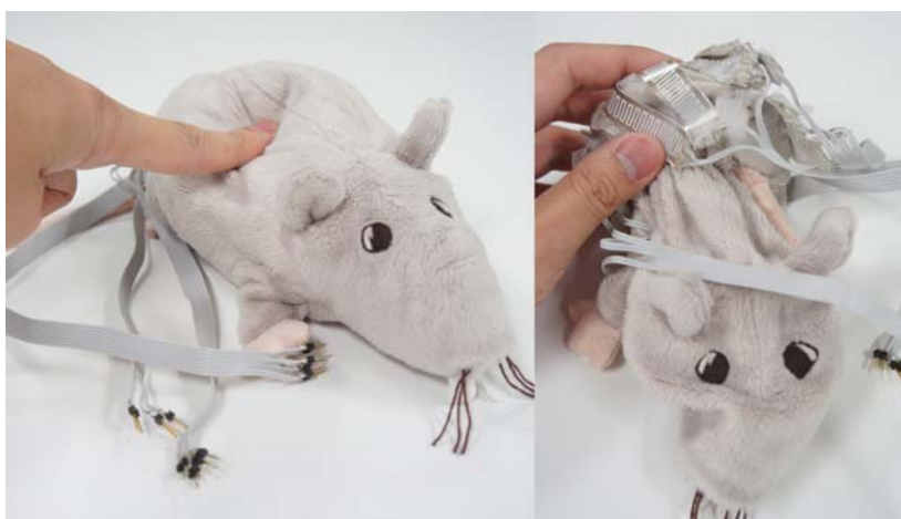
図3 柔軟なタッチセンサにより触ったことが検知可能なぬいぐるみ。