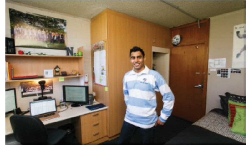
John XXIII College residentの部屋の様子