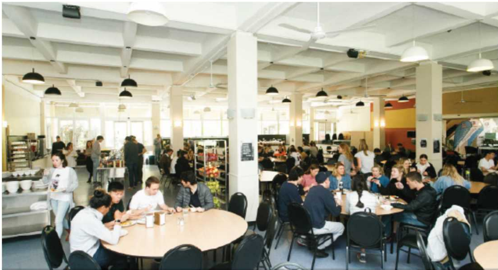
John XXIII College のダイニングホール