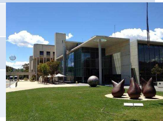
National Gallery of Australia