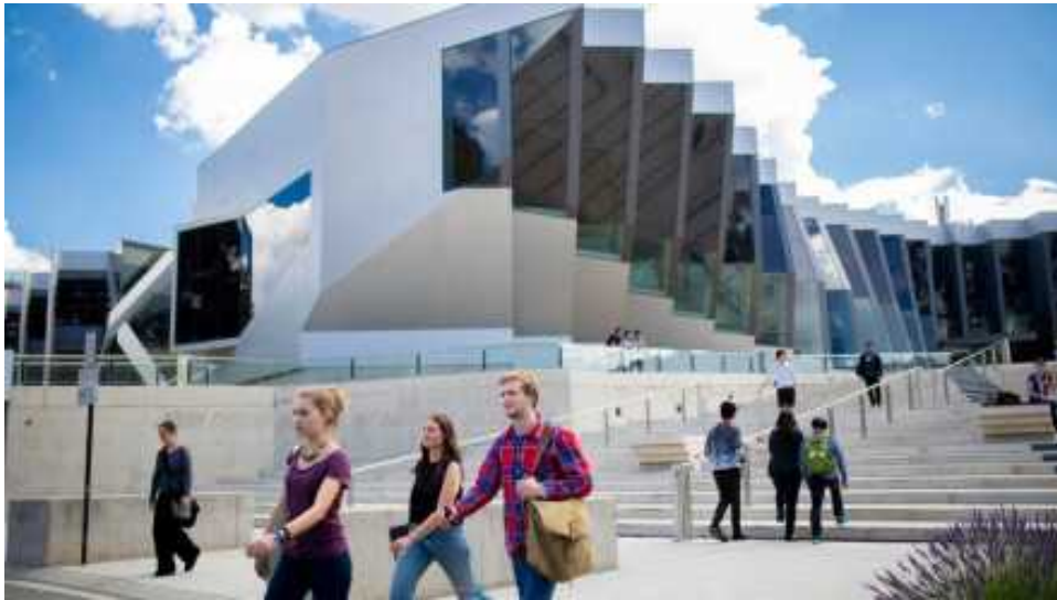
John Curtin School of Medical Research, ANU