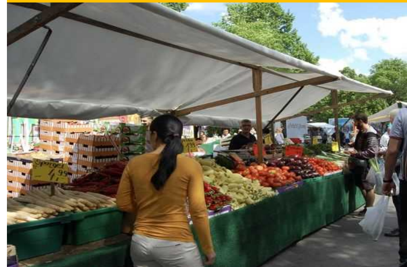
トルコマーケット (クロイツベルク)