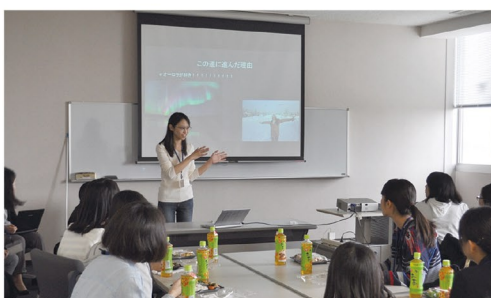
先輩理系女子の講演