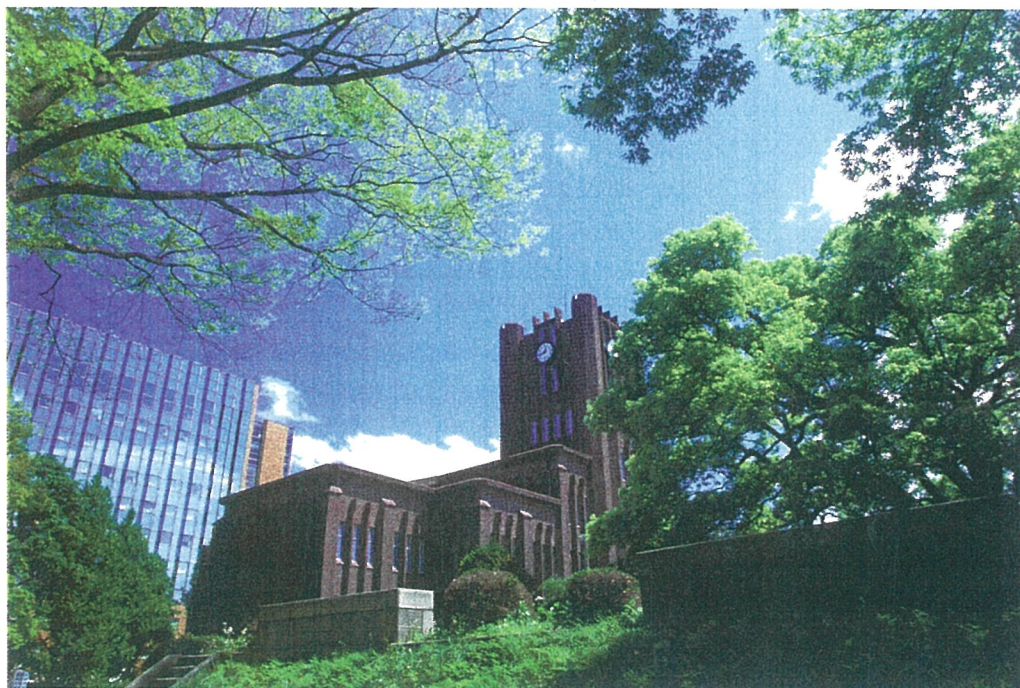
大講堂（本郷キャンパス）