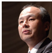
孫 正義 ソフトバンクグループ株式会社 代表取締役 会長兼社長執行役員