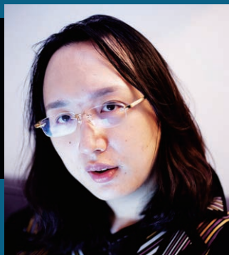
オードリー・タン 台湾デジタル担当大臣