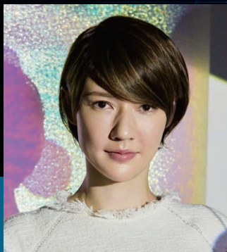
スプツニ子! アーティスト/デザイナー/ 東京藝術大学デザイン科 准教授