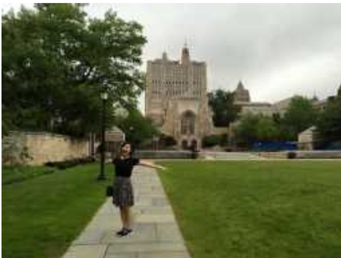
In front of the Sterling Library

(2) Please submit any photographs which may be used on the University of Tokyo websites or publications.