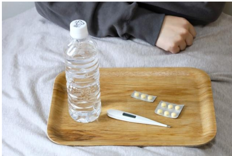
自宅療養のイメージ