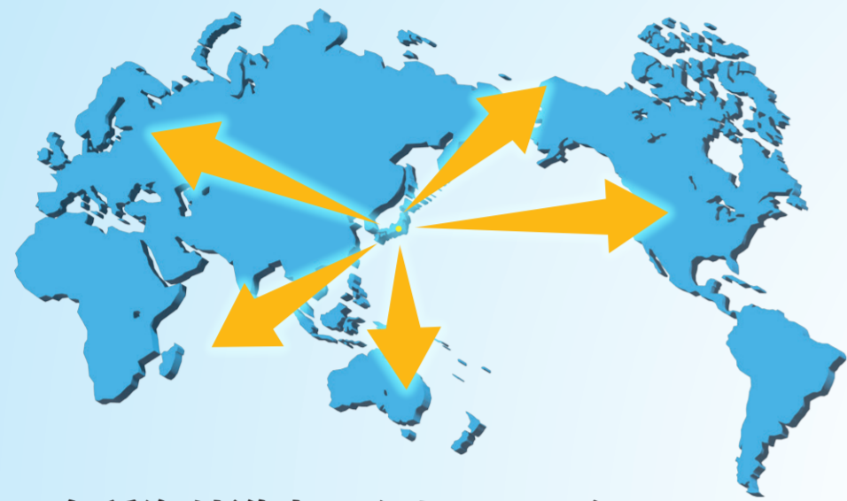
各種海外進出アクセラレーション プログラム (JETRO, GTIE)

研究成果を活用して立案した事業化構想を基にして 各種GAPファンドの採択を勝ち取りましょう!