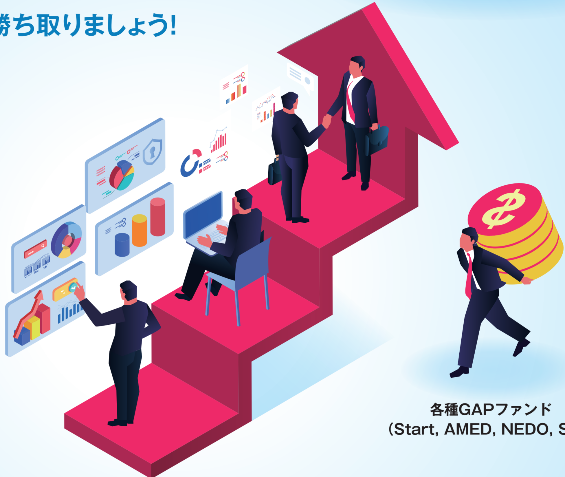
各種GAPファンド (Start, AMED, NEDO, SBIR)