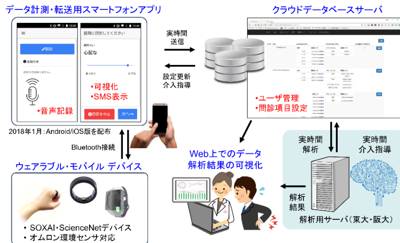
デジタルヘルス介入システムの全体図