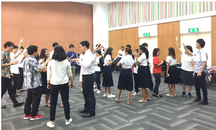
画像は2019年度現地開催のもの