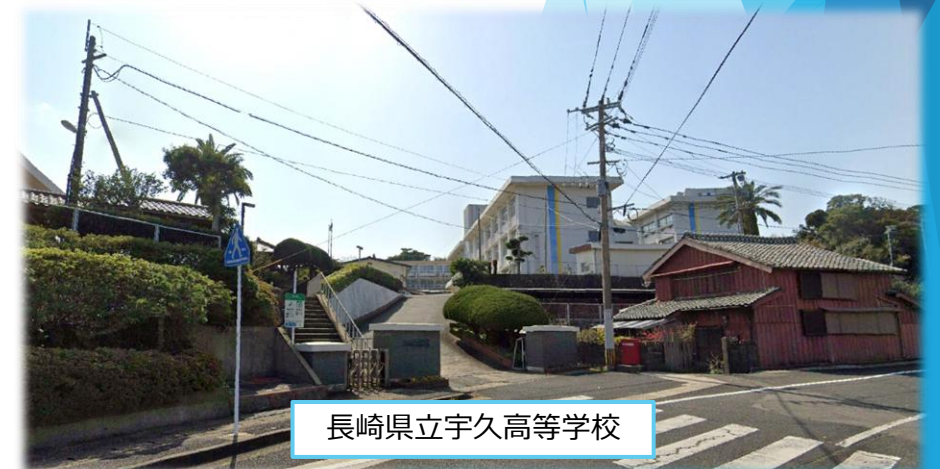
長崎県立宇久高等学校