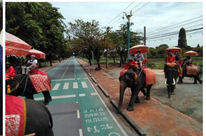
画像は2019年度現地開催のもの