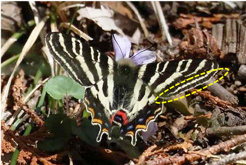
図：石砂山で発見されたギフチョウの成虫写真。本来、神奈川県の個体の翅の縁は黒色と黄色の縞模様となるが、石砂山の成虫個体の一部はイエローバンド(翅の縁が一様に黄色くなる、写真の黄色い点線内を参照)と呼ばれる長野県北部の個体にみられる特徴を持っていた。

そこで研究グループは、神奈川県石砂山を含めたギフチョウの集団遺伝解析によって、当地における遺伝的攪乱の実態を明らかにしました。